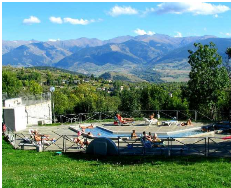
Los baños romanos de Dorres

Los baños de Dorres están a 400 m de la casa rural Navarre.